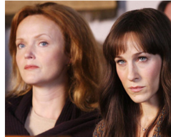
2007 APPARENCE TROMPEUSE (Spinning into Butter) de Mark Brokaw avec Sara Jessica Parker