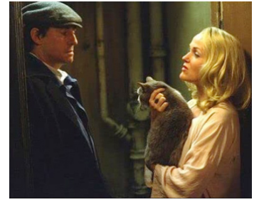
2002 SPIDER (Spider) de David Cronenberg avec Gabriel Byrne