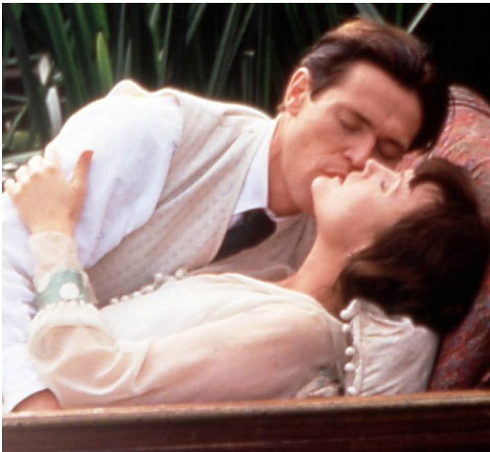
1994 TOM ET VIV (Tom & Viv) de Brian Gilbert avec Willem Dafoe