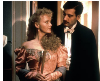
1993 CENTURY (Century) de Stephen Poliakoff avec Clive Owen