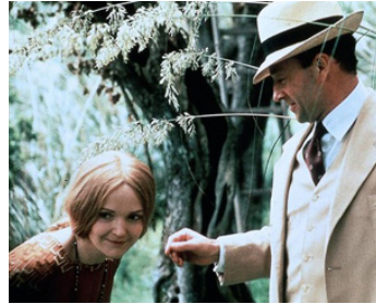
1992 AVRIL ENCHANTÉ (Enchanted April) de Mike Newell avec Michael Kitchen