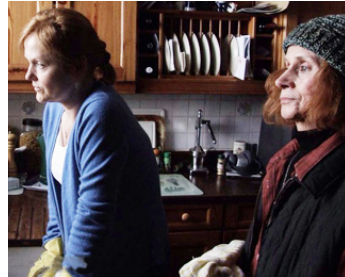
2007 PUFFBALL (Puffball) de Nicolas Roeg avec Rita Tushingham