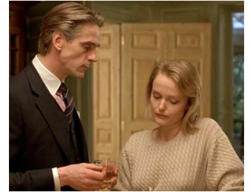
1992 FATALE (Damage) de Louis Malle avec Jeremy Irons