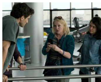
2017 STRONGER (Stronger) de David Gordon Green avec Jake Gyllenhaal, Kati Outinen