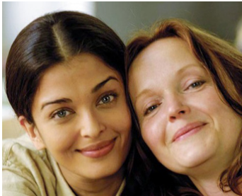
2007 PROVOKED (Provoked, a true Story) de Jag Mundhra avec Aishwarya Rai Bachchan