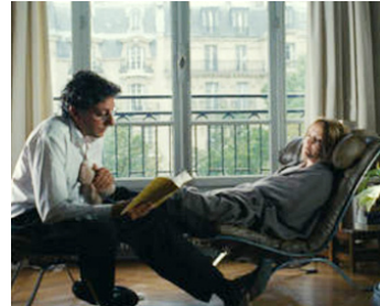
2006 PARIS, JE T'AIME, segment Bastille d'Isabel Coixet avec Sergio Castellitto