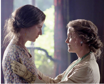
2002 THE HOURS (The Hours) de Stephen Daldry avec Nicole Kidman