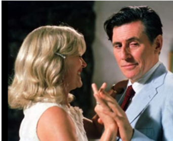
2005 WAH-WAH de Richard E. Grant avec Gabriel Byrne