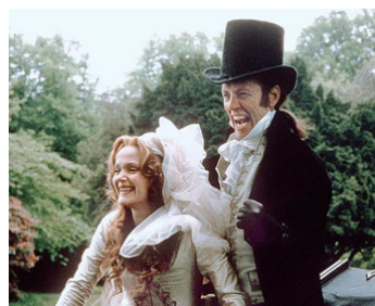
1998 SAINT-IVES (St Ives) d'Harry Hook avec Richard E. Grant