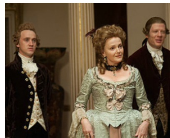
2013 BELLE (Belle) d'Amma Asante avec Gugu Mbatha-Raw