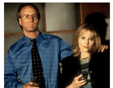
1999 THE BIG BRASS RING de George Hickenlooper avec William Hurt