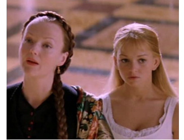
2004 LE FANTÔME DE L'OPÉRA (The Phantom of the Opera) de Joel Schumacher avec Jennifer Ellison