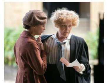
2014 MÉMOIRES DE JEUNESSE (Testament of Youth) de James Kent avec Alicia Vikander