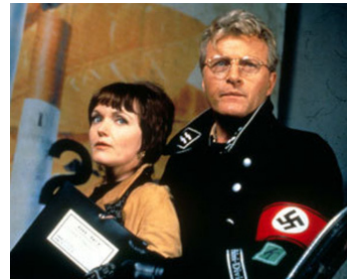
1995 LE CRÉPUSCULE DES AIGLES (Fatherland) de Christopher Menaul avec Rutger Hauer