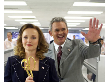
2006 SOUTHLAND TALES (Southland Tales) de Richard Kelly avec Holmes Osborne