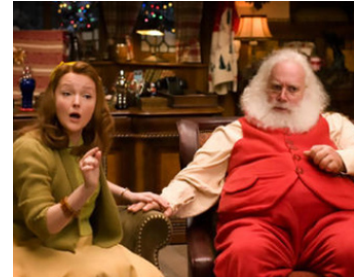
2007 FRÈRE NOËL (Fred Claus) de David Dobkin avec Paul Giamatti