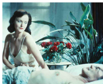
1996 SAINT-EX (Saint-Ex) d'Armand Tucker avec Bruno Ganz