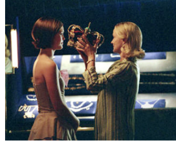
2004 LE PRINCE ET MOI (The Prince and me) de Martha Coolidge avec Julia Stiles