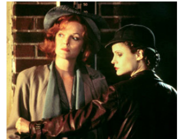
1996 KANSAS CITY (Kansas City) de Robert Altman avec Jennifer Jason Leigh