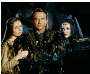
1998 MERLIN (Merlin) de Steve Barron avec Isabella Rossellini, Sam Neill