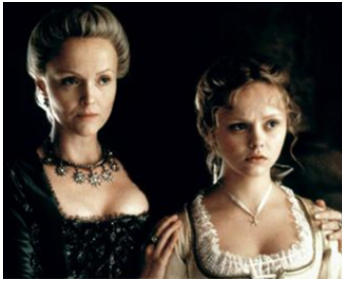
1999 SLEEPY HOLLOW (Sleepy Hollow) de Tim Burton avec Christina Ricci