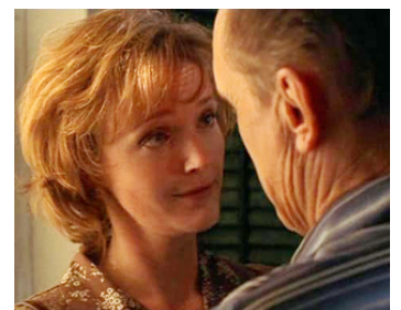
1998 LE PRÉDICATEUR (The Apostle) de et avec Robert Duvall