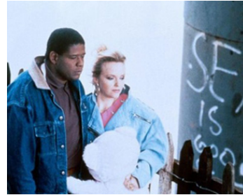
1992 THE CRYING GAME (The Crying Game) de Neil Jordan avec Forest Whitaker