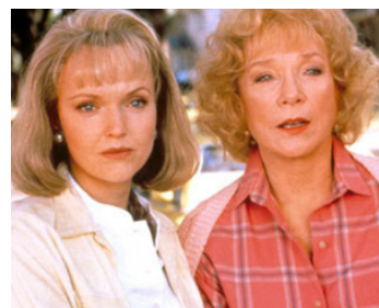
1996 ÉTOILE DU SOIR (The Evening Star) de Robert Harling avec Shirley MacLaine