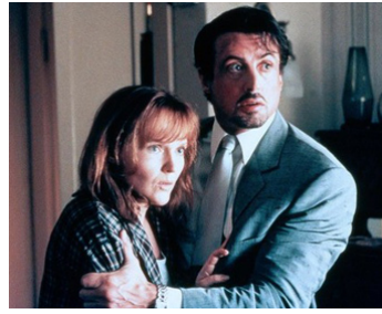
2000 GET CARTER (Get Carter) de Stephen T. Kay avec Sylvester Stallone