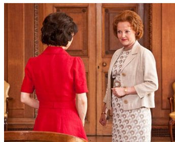
2010 WE WANT SEX EQUALITY de Nigel Cole avec Sally Hawkins