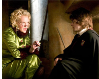
2005 HARRY POTTER ET LA COUPE DE FEU (The Goblet of Fire) de M. Newell avec D. Radcliffe