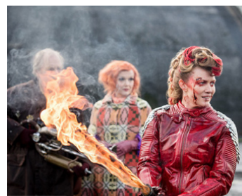
2019 GOOD OMENS de Neil Gaiman & Terry Pratchett avec Michael McKean, Mireille Enos