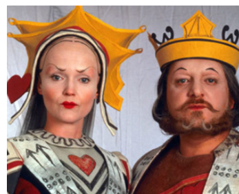
1999 ALICE AU PAYS DES MERVEILLES (Alice in Wonderland) de Nick Willingag avec Russell Beale