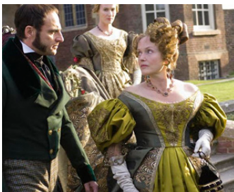
2009 LES JEUNES ANNÉES D'UNE REINE (Young Victoria) de Jean-Marc Vallée avec Mark Strong