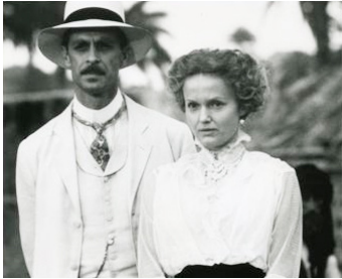
1990 CHER DOCTEUR GRÄSLER (Mio Caro dottor Gräsler) de Roberto Faenza avec Keith Carradine