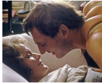
1985 THE INNOCENT (The Innocent) de John Mackenzie avec Liam Neeson