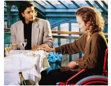
1989 LE RÊVE DU SINGE FOU (El Sueño del mono loco) de Fernando Trueba avec Jeff Goldblum