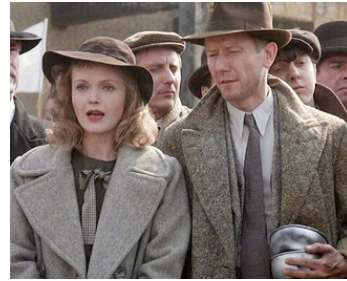
1987 EMPIRE DU SOLEIL (Empire of the Sun) de Steven Spielberg avec Leslie Phillips